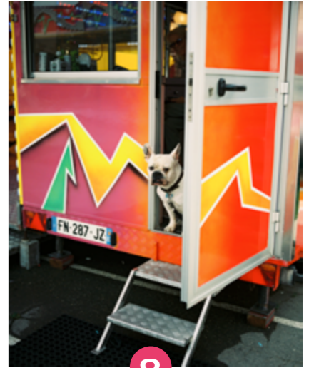
8 Céline Villegas

Remise des prix du Marathon Photo MAP 2024 avec projection des photographies des lauréats, en partenariat avec Numériphot.