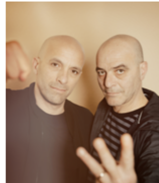
Portrait de Mouss et Hakim