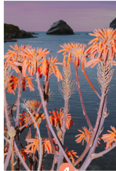
4 Letizia Le Fur