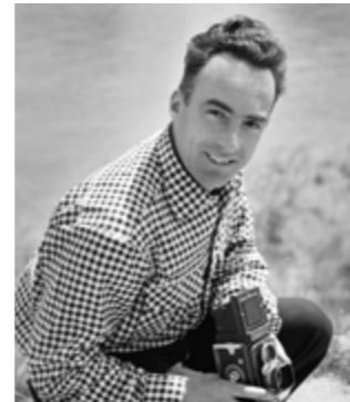
Portrait de Jean Dieuzaide, 1952

Les spectateurs sont transportés dans un voyage à travers le temps, où la musique vient illustrer les moments figés par ces deux maîtres de la photographie. Les accents rocailleux, tendres, joyeux et mélancoliques de la musique de Mouss et Hakim résonnent, faisant écho aux images chargées d'histoire et de mémoire collective.