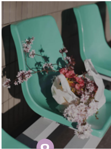
9 Louise Desnos