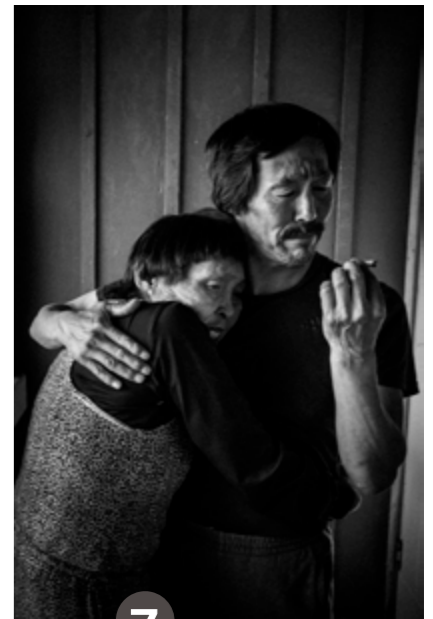
7 Olivier Laban-Mattei