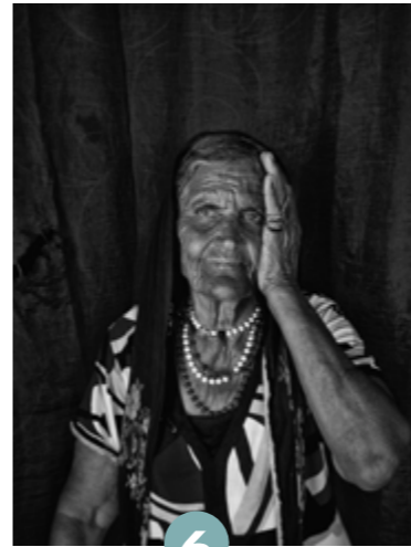
6 Nikos Aliagas

Talk Rencontre / Projection avec la BNF sur la Grande Commande Photographique de l'État en présence de Emmanuelle Hascoet , directrice de la Grande Commande BNF, ainsi que Céline Villegas et Laurent Moynat , photographes.