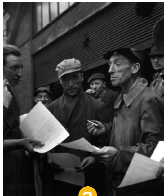
3 Robert Doisneau